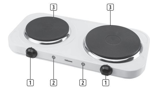
OPIS DIJELOVA / OPIS DELOVA / OPIS SESTAVNIH DELOV / PARTS DESCRIPTION