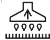
механизированная очистительная головка для водоструйной очистки.