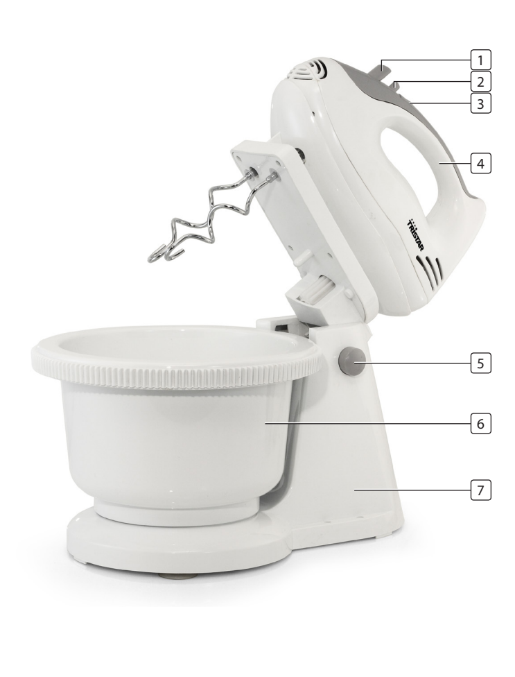
ABB. / OBR / SLIKE / ILUSTRACJA / FIG. / OBR / ФИГ.

TEILEBESCHREIBUNG / POPIS SOUČÁSTÍ / OPIS DIJELOVA / OPIS CZĘŚCI / DESCRIEREA PIESELOR / POPIS SOUČASTÍ / ОПИСАНИЕ НА ЧАСТИТЕ