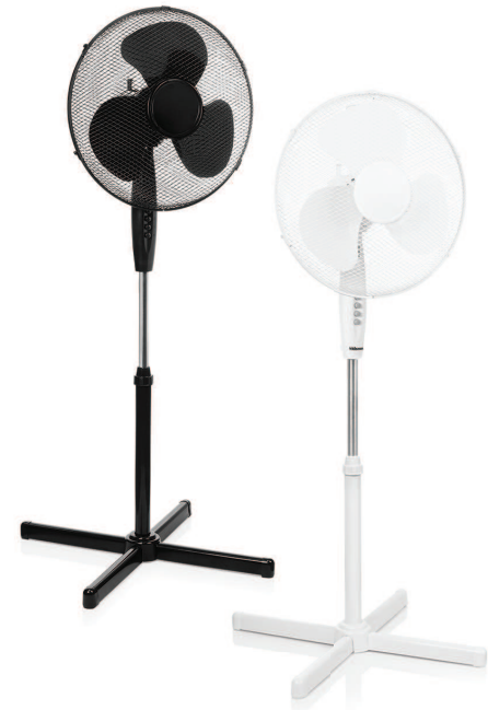
VE-5893 / VE-5894

PARTS DESCRIPTION / ONDERDELENBESCHRIJVING / DESCRIPTION DES PIÈCES / TEILEBESCHREIBUNG / DESCRIPCIÓN DE LAS PIEZAS / DESCRICÃO DOS COMPONENTES / DESCRIZIONE DELLE PARTI / BESKRIVNING AV DELAR / OPIS CZĘŚCI / POPIS SOUČÁSTI / POPIS SOUČASTI / OSIEN KUVAKSEK