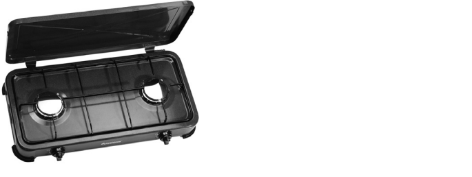
Indicazioni sulle manopole del gas