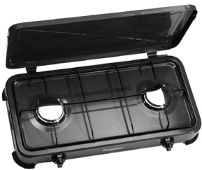
Marcas de la llave de gas

Abra el cierre de la tapa y abra la tapa