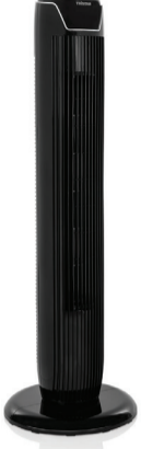
TRISTAR KULE TİPİ VANTİLATÖR MODEL: VE-5892