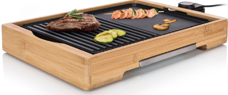
TRISTAR IZGARA MODEL: BP-2640