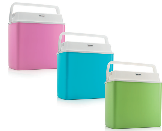
KB-7424JUR / KB-7424JUB / KB-7424JUG