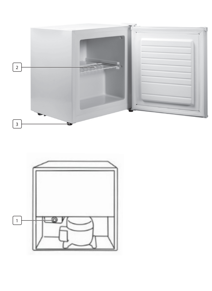
FIGURE / FIGUUR / IMAGE / ABBILDUNG / FIGURA / FIGURA / RYSUNEK / FIGURA / FIGUR / OBRÁZOK / OBRÁZOK / 2