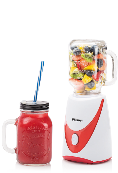
TRİSTAR BLENDER MODEL: BL-4456