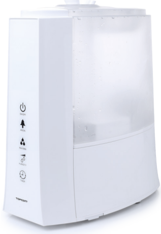
TOPCOM HAVA NEMLENDİRİCİSİ MODEL: LF-4720