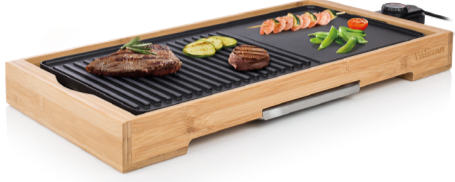
TRISTAR IZGARA MODEL: BP-2641