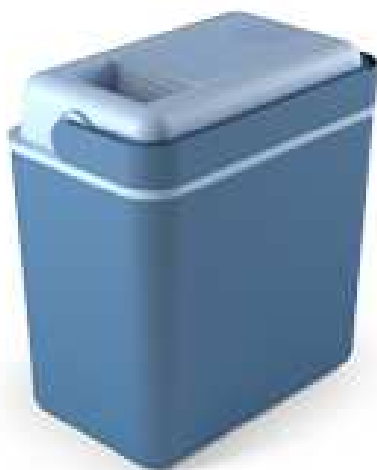
KB - 7234