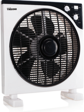
TRISTAR KUTU VANTİLATÖR MODEL: VE-5996